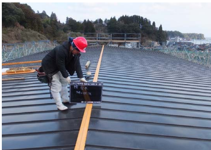
4階議事堂の屋根ができ、外回りの主要な部分はほぼ組み上がりました。