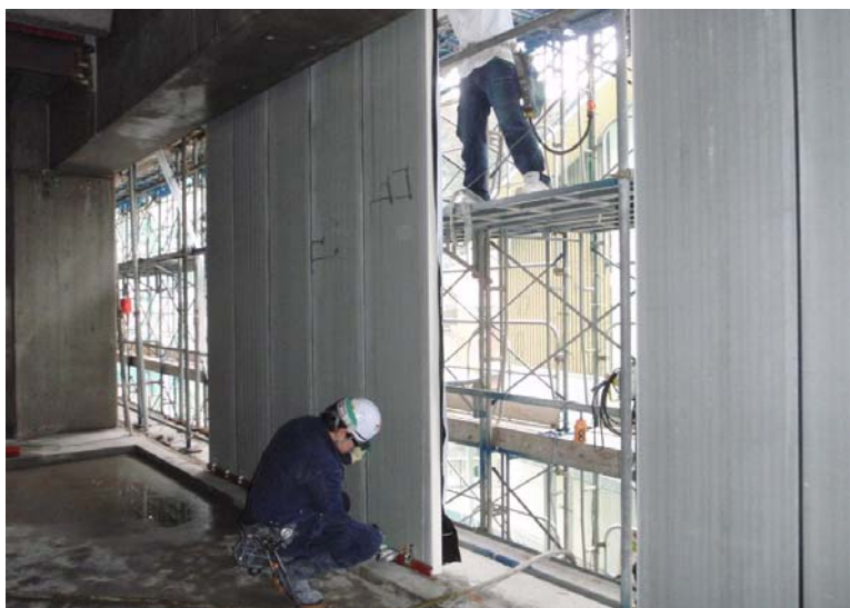
外壁工事やサッシ取付、防水工事等の内装工事も進んでおります。