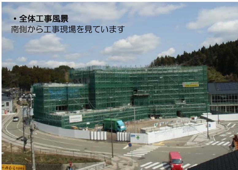
・全体工事風景 南側から工事現場を見ています