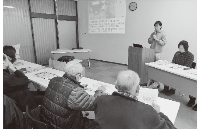
観光コースなどを提案する町野荘調査研究会メンバー