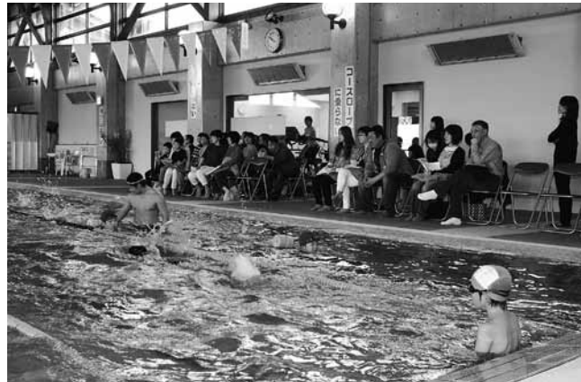
保護者の前で練習を披露する児童たち

「なごみ」では毎週火・木・金・土曜日に水泳教室を開講していて、習熟度別の8教室に約60人が通っています。この日は20人が発表会に参加し、応援に駆けつけた保護者に泳ぎを披露しました。