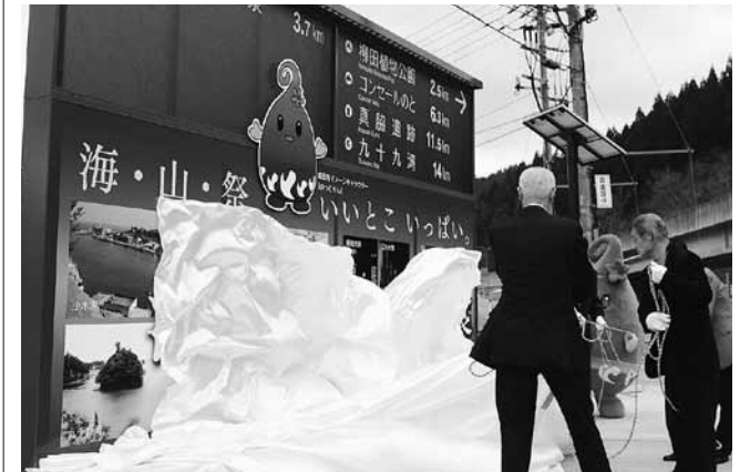
除幕して姿を見せた大型案内サイン