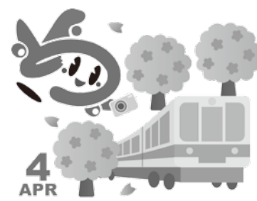
のっぴーお花見・桜の駅

■12日(日)のっぴーグラスづくり デザイン「のっぴーのお花見・桜の駅」 時間 10:00 ~ 12:00、13:00 ~ 15:00 場所 空港1階 能登の旅情報センター 一家族1個。小学生以下優先、限定50個、参加無料