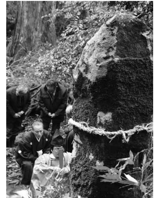
「前立」と呼ばれる巨石の前で神事を行う