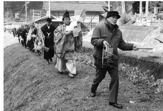
触れ太鼓を先頭に山へ向かう一行

山は結界が貼られていて、女人禁制とされています。刃物の持ち込みが禁じられていることから巨木が残り、周囲の山々とは異なる景観をみせています。氏子らは「前立」と呼ばれる高さ約3mの巨石の前で神事に臨み、祈りをささげました。