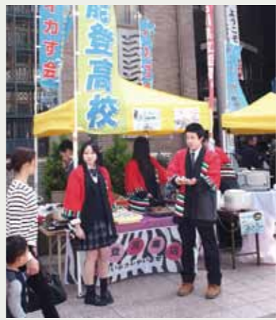
金沢市・近江町いちば館前で販売実習に臨む地域創造科の生徒(3月22日)

躍に期待を寄せました。地域創造科の生徒は、現在は一緒に授業を受けていますが、今後は農業や福祉などのコースを選択し、専門知識を身につけます。