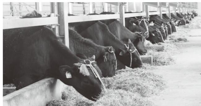
明るい牛舎ですくすくと育つ 能登牛

泉の「能登牧場」で育てられた能登牛 2 頭が 5 月 21 日に初出荷されました。平成 24 年に生まれた去勢牛で体重は推定 850kg です。平成 26 年 10 月に営農を開始した能登牧場では、生産農家から受け入れた肉牛の肥育を行っています。能登牛は数が少ないため、ほぼ県内でしか流通していないのが現状です。県はブランド牛としての地位確立のため、能登牛の年間 1,000 頭出荷をめざして、県内最大の肥育設備を持つ能登牧場がブランド化に大きな役割を担います。