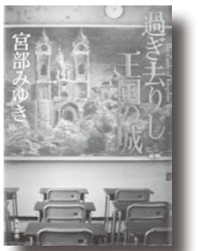
過ぎ去りし王国の城 宮部みゆき