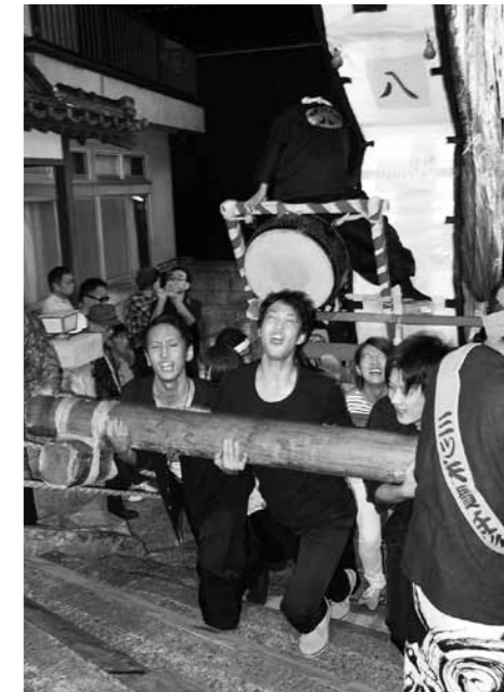
力を込めて石段を登る担ぎ手