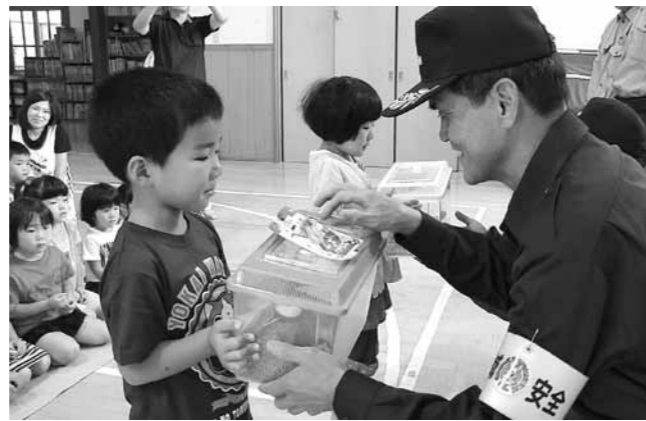
園児にスズムシを手渡す防犯委員