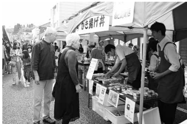
オリジナルグルメを求めて、多くの人が屋台を訪れた

ご当地グルメグランプリ in 能登町が9月13日、宇出津新町通りで開かれました。合併10周年の町民提案事業として実施されたもので、商店や地元の有志ら14団体が店を並べ、能登牛や小木港のイカ、ブルーベリーなど、能登の食材を使用したオリジナルメニューが提供しました。使用した割り箸によって投票が行われ、三波公民館が出品した「能登牛味噌漬丼」がグランプリに選ばれました。