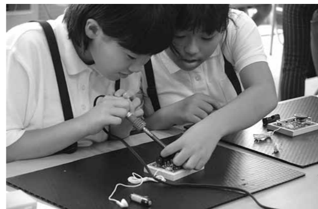
初めて使うハンダゴテに緊張しながら線をつなげる児童

「おもしろ電波教室」が8月25日に開催され、柳田小学校6年生25人が電波の仕組みや大切さについて学びました。北陸総合通信局と県電波適正利用推進員協議会が毎年行っていて、今年で12回目となります。児童たちはアンテナで電波を受ける実験や、部品をハンダ付けするラジオ製作に臨みました。完成すると、受信できる放送局を探しにベランダに出て、場所や角度によって変わる電波の性質を体験しました。