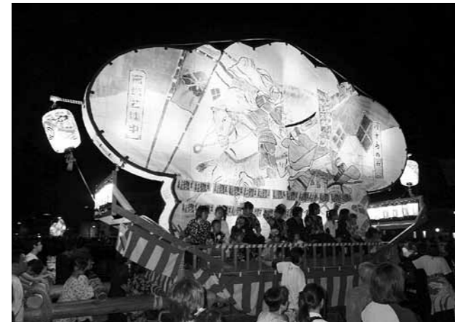
キリコは袖を広げたような形をしている

19日夜には、キリコが御船神社に続く石段を登る「宮上げ」があり、町内の引き手が「ヨイトショー」の掛け声に合わせて綱を引き、細い急坂を登りました。一進一退を繰り返しながらようやく坂をのぼりきると、見学していた人から大きな拍手が巻き起こりました。