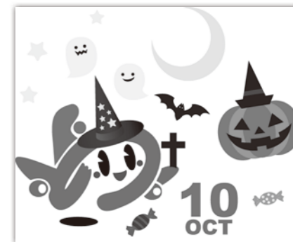
のっぴーのハロウィン

東京へ行く！のと里山空港ウルトラクイズ 東京へ行く！紙飛行機 的入れゲーム 能登よさこい祭り・空の陣／紙アプリ／なりきりパイロット！ フライトシミュレーター／県消防防災ヘリ救助訓練デモンストラクション／空港消防放水訓練／県警音楽隊によるマーチング／かわいい風船 バルーンアート／空港内バスツアー／ のっぴーグラス作り／子ども自動車乗車会／空の日絵画展／ロコモ度をチェックして足腰を元気にしよう／お茶会／まいもん市／のっぴーフリマ