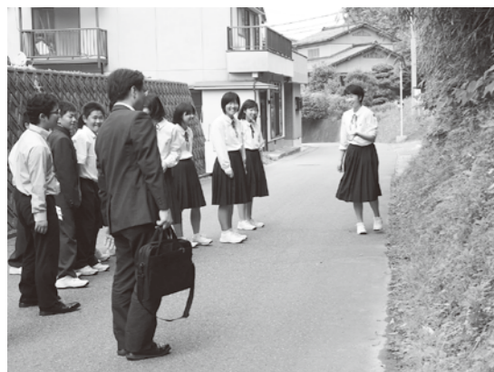
避難誘導灯の設置について説明する生徒

視察団員による講評があり、「皆で作上げ、前に進むという姿勢がすばらしい」と、生徒の防災の取組に対する感想が述べられました。