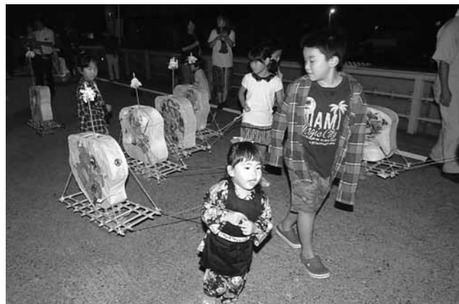
名前などが描かれた自分の「ミニにわか」を引く子どもたち

鶴川公民館の有志による「ふるさと再発見研究会」の「ミニミニにわか祭」が9月9日の夜、鶴川地内で行われました。保育園児から中学生までの約30人が、高さ70センチほどのミニにわかを引き、海瀬神社を目指して街中を練り歩きました。ミニにわかには、本物と同様に迫力ある武者絵が描かれているほか、子どもの名前なども入っています。参加者は愛着ある「マイにわか」と共に秋の夜のひとときを楽しみました。