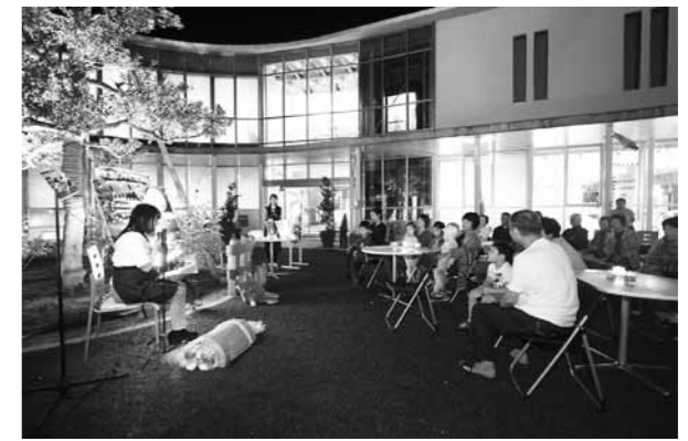
絵本の朗読に聞き入る参加者