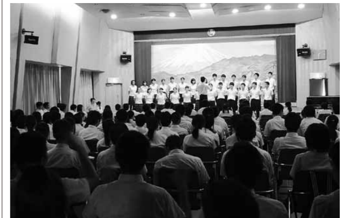
練習の成果を発揮し、息のあった合唱を見せる生徒