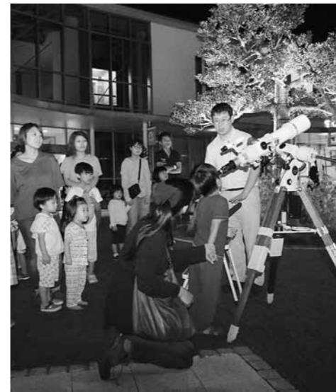
望遠鏡で月や星座を観察した

このイベントに合わせて中央図書館や観光ステーション「たびスタ」が夜間まで特別開館しました。満天星の星の先生が選んだ本を並べた特設コーナーも設けられ、訪れた人は思い思いに秋の夜長のひとときを楽しみました。