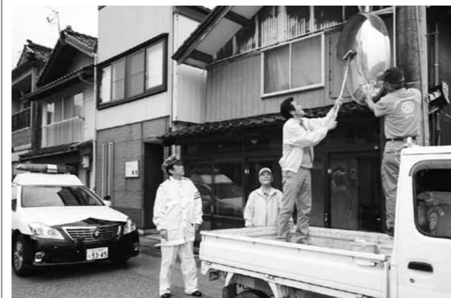
雨の中、丁寧にミラーを磨く能都ロータリークラブ会員

この日はあいにくの雨模様となりましたが、会員は6班に分かれ現場に向かい、珠洲署員が交通整理をして安全を確保する中、ぞうきんや窓用洗剤などを使って丁寧にミラーを磨き上げました。