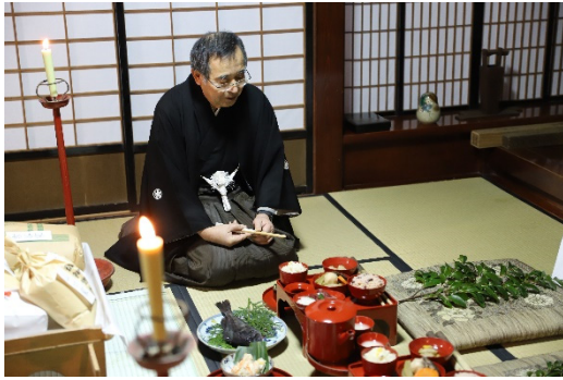
世界無形文化遺産「あえのこと」

本地域は、自然の恵みへの感謝の気持ちや神への信仰心が強く、各地では日本遺産に認定された「キリコ祭り」、世界無形遺産である「あえのこと」や「アマメハギ」などの民俗行事が今も受け継がれている。