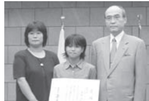
谷本知事と記念撮影