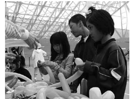
▲バルーンアートに挑戦する子どもたち

能都地区子どもを守る会とこどもみらいセンター、みらい子育てネットのついでが主催。幼児から小学校高学年までの親子を対象に、ゲームや遊びを通じて親子の触れ合いを大切にしてもらおうと企画されました。会場の周りには、バルーンアートや輪投げなど子どもたちが楽しめる出店も出店。子どもたちは会場全体を元気に走り回っていました。