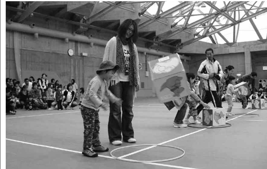
◀おんぶやだっこなど、サイコロの目に従ってゴールする「好きんシブ」