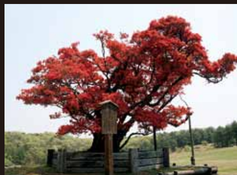
⑪ 能登町柳田植物公園 (上町)