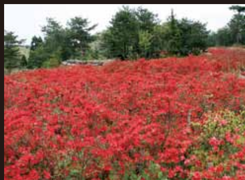
⑨ 炭谷ツツジ園 (武連)