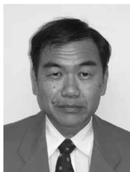
石川県林業試験場