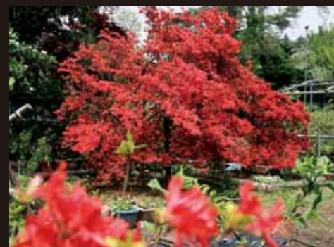
⑬ 新谷英夫家 (柳田)