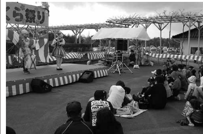
ステージ上にピエロが登場。楽器を使って曲当てクイズ

公園入口付近から並ぶ約50本のソメイヨシノ。そのそばに作られた特設ステージでは、最初にもどもみらいセンターやっちゃ連が元気いっぱいによさこいを披露しました。そのあとも弥栄太鼓やYAMABIKO 柳星乱舞隊などが次々と登場し、イベントを盛り上げていました。この日は約千人の見物客が植物公園を訪れ、イベントと公園の散策を満喫しました。