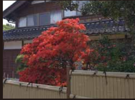
② 蔵屋家 (秋吉)