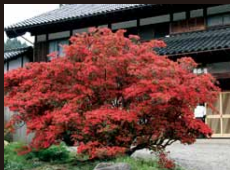
⑩ 多田家春蘭の宿 (宮地)