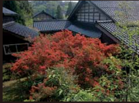
③ 背戸家 (秋吉)