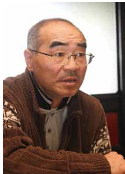
御所桜を守る会 事務局