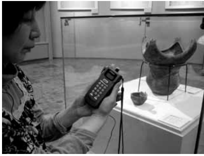
▲更新された4カ国語で案内する機器

真脇遺跡縄文館は、展示物を見ながら音声解説を聞くことができるイヤホン式の案内機器を更新し、対応言語に中国語を加えました。 従来は日本語、英語、韓国語の3カ国語でしたが、増加傾向にある中国人観光客に対応するために更新されました。各展示品の番号を入力するとイヤホンから説明を聞けます。機器は20台あり、来館した希望者には無料で貸し出します。