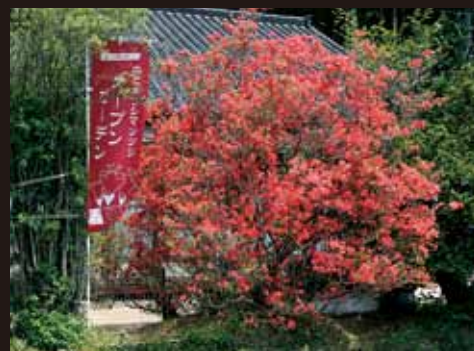
⑫ 福池家 (天坂)