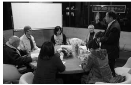
▲第1回サロンの様子。本年度のサロンは6回とも役場能都庁舎が会場になります。

地域住民の皆さんと在住外国人とが交流する本年度2回目の国際交流サロンは、6月15日午後7時から能登町役場能都庁舎2階ロビーで開催されます。国際交流に興味のある人は、お気軽にご参加ください。