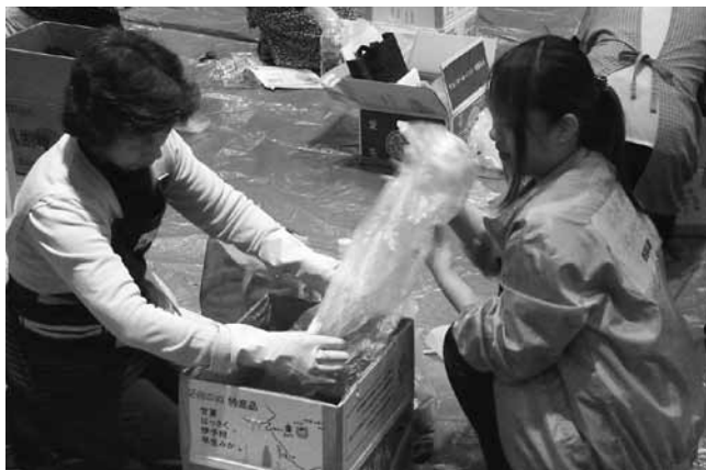
バイオマス推進員がコンポスト作りを指導

参加者は、家庭で出る生ごみや食べ残しを肥料として再生することが出来るダンボールコンポストを作りながら、説明を受けました。そのあと、オカラを使ったエコクッキングを体験。水分をとばしたオカラをホットケーキミックスやバター、牛乳などと混ぜて揚げ、おからドーナツを作りました。参加者同士楽しみながらバイオマスについて学んでいました。