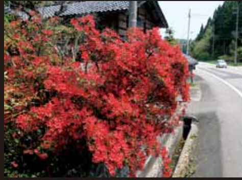
④ 椿原家 (時長)