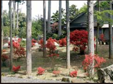
⑤ 万年寺庭園八景苑のとキリシマ苑 (七見)