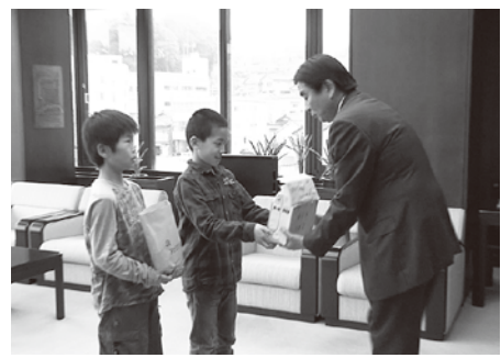
義援金を手渡す宇出津小児童会代表（5月6日）

▽平体町内会▽鶴川天神町だるま会▽小棚木町内会▽浜小路町内会▽崎山三丁目町内会▽城野町町内会▽四方山町内会▽九里川尻町内会▽山中満泉寺町内会▽錦町町内会▽下岩屋町内会▽天徳町町内会▽中組町内会（宇出津）▽中ノ又区▽立町町内会▽さくら団地▽天坂区▽太田原町内会▽黒川区▽大平町内会▽作原明雄（宮大）▽河ヶ谷町内