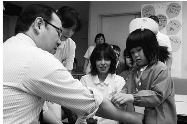
看護師の指導を受けながら傷の手当てを体験する園児