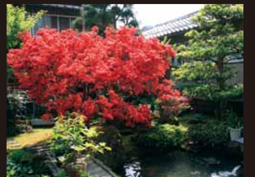
⑬ 梅家 (柳田)