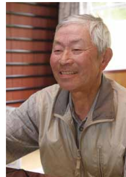
御所桜を守る会 会長