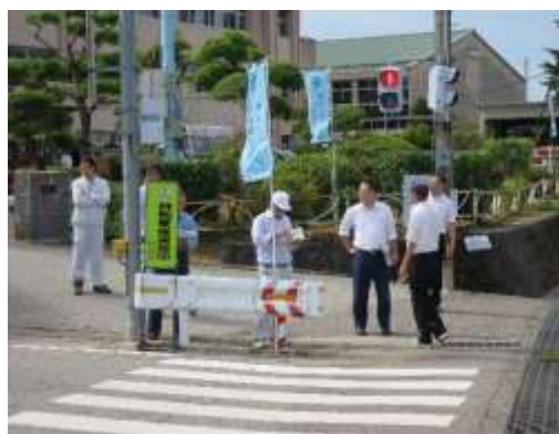
平成26年9月の安全合同点検の様子