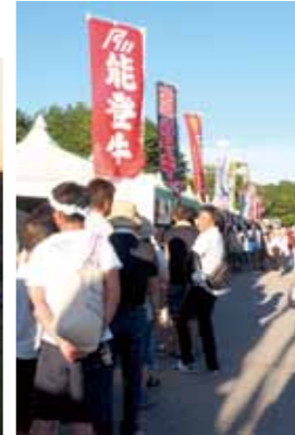
グルメテナントも盛況