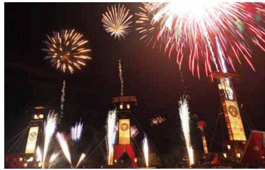
キリコの真上で開く花火は圧巻

8月20日、柳田植物公園で恒例のイベント「ござれ祭り」が開催され、多くの人が訪れてにぎわいました。太鼓や歌謡ショーなどステージイベントに加え、今年は書道パフォーマンスやレーザーショーが行われ、観客から大きな拍手がおこられました。 夜にはずらりと並んだ16基のキリコの真上で打ち上げ花火が夏の一夜を鮮やかに彩りました。