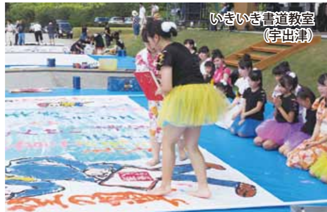
いきいき書道教室 (宇出津)

書道パフォーマンスは縦4尺、横6尺の巨大な紙を使うもので、音楽に合わせて文字や絵が縦横無尽に描かれました。出演したのは、書道教室に通う小中学生や同窓生など6団体です。数々のパフォーマンス実績を持つ能登高校書道部の生徒が、各団体のサポートにあたりました。 3人の書家による「三世代交流『筆まつり』実行委員会」は公益信託エンデバーファンド21の助成を受け、筆などの備品を準備しました。今回のパフォーマンスには多くの人が訪れ、手応えを感じています。今後も書道イベントを継続することとしています。