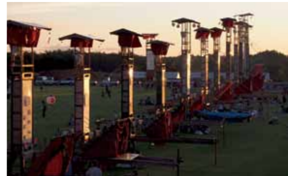
夕日を受けて輝くキリコ