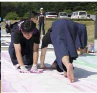
Soul mate (宇出津)