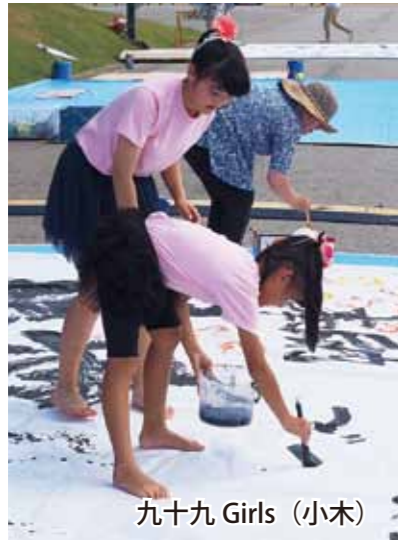
九十九 Girls (小木)