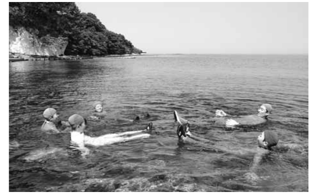
ウェットスーツを着てスノーケリングに挑戦