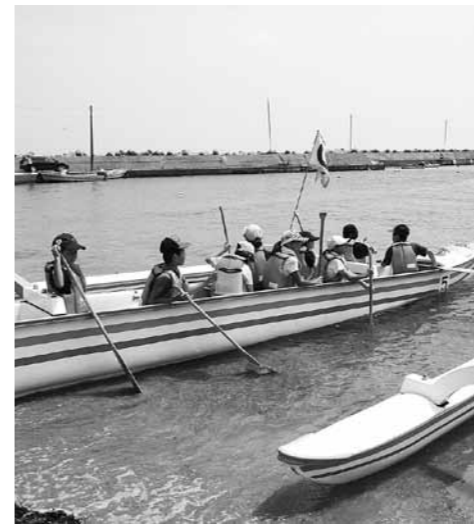
大型カヌーで沖に繰り出す児童たち

翌日はうみとさかなの科学館で海藻を使ったポストカードを作ったり、のと海洋ふれあいセンターでスノーケリングに挑戦したりしました。スノーケリングではセンターのボランティア組織「のとスノーケリング研究会・海もぐら」メンバーの案内で、透明度高い能登の海での海中散歩を楽しみました。