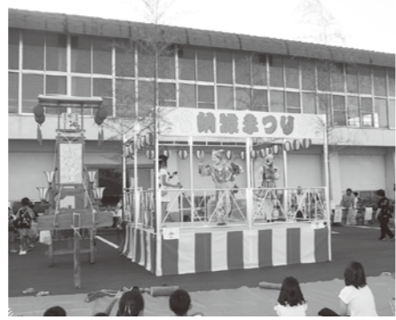
柳田納涼祭りで使用された祭りやぐらステージ

一般財団法人自治総合センターが行う「コミュニティ助成事業」の助成を受けて、柳田納涼祭り実行委員会がやぐらステージを購入し、8月14日の納涼祭りで活用しました。