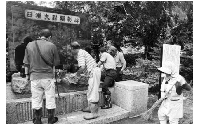
白洲大尉の顕彰碑を清掃する会員