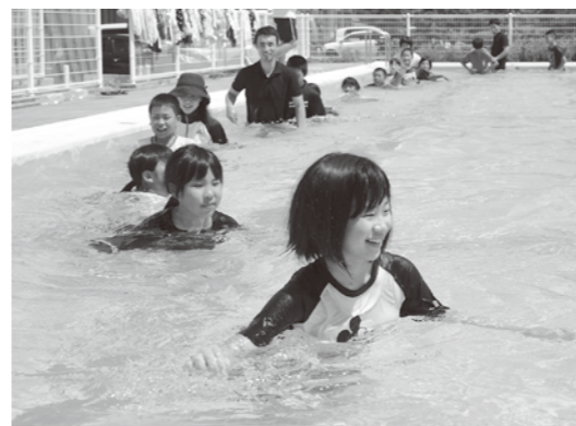
離岸流の強さを体感する児童たち

能登海上保安署は8月5日、小木小学校の5~6年生26人を対象に海のある講習会を行いました。水着の上に着た児童たちは、そのままプールに入り、一列になって時計回りに歩きました。署員の合図で歩みを止めると、流れによって体が流され、離岸流の強さを体感しました。あおむけになって浮いて呼吸を確保する「背浮き」の実技に臨みました。「力を入れると沈むので、力を抜いて」と署員からアドバイスを受けた児童たちは、流れに逆らわず、浮いて救助を待つことを確認しました。