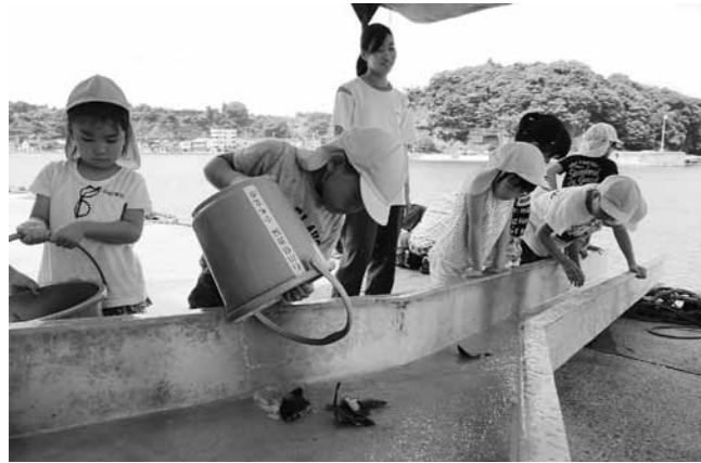
「大きくなってね」と稚魚を放流する園児たち

7月27日、県漁協小木支所でヒラメの放流があり、小木保育園の園児と学童保育利用者の合わせて16人が体長10センチほどの稚魚5千匹を放流しました。園児たちは県水産総合センター志賀事業所で育てられた稚魚をバケツに移し、漁協の荷さばき所に設けられたスロープから「大きくなってね」と声をかけて、そっと流しました。海に泳ぐ稚魚を見つけた園児は、歓声を上げたり、手を振ったりして旅立ちを見守りました。