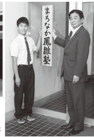
持木町長と生徒代表が看板を掲げた

旧宇出津公民館で開設準備が進められていた「まちなか鳳雛塾」が8月4日に開塾しました。講師2人がサポートし、学力を高めます。まちなかに拠点が設けられたことにより、さまざまな考え方に触れることができ、町の将来を担う人材の育成や地域の活性化につながる事が期待されます。