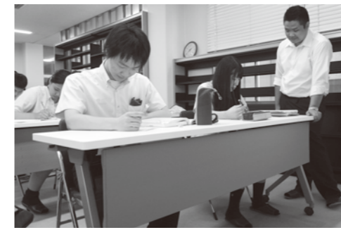
自習室を利用する塾生たち