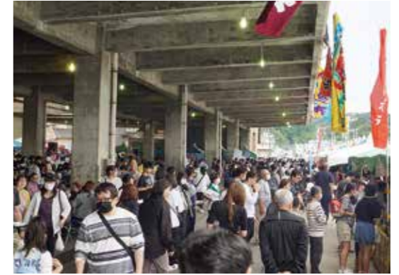
賑わいをみせる会場

会場には体験イベントが盛りだくさん。プールや水槽で行われた「朝獲れイカのつかみどり&一本釣り」コーナーには家族連れ