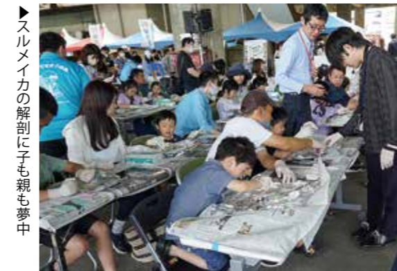
スルメイカの解剖に子ども親も夢中